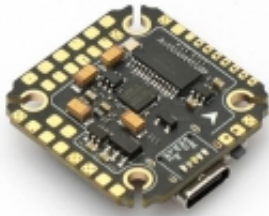
MAMBA F405 MINI MK3.5