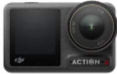
DJI CARE REFRESH (OSMO ACTION 4)

Link do produktu: https://www.nobshop.pl/dji-dji-care-refresh-dji-osmo-action-4-roczny-plan-kod-elektroniczny-p-4130.html